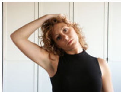
1 - Flettere il capo lateralmente a destra, mantenere la posizione per 30". Ripetere a sinistra

Per effettuare un buon allenamento è importante ripetere gli esercizi illustrati più volte, con una giusta pausa tra un esercizio e l'altro arrivando ad allungarsi sempre fino ad una soglia del dolore non eccessiva.